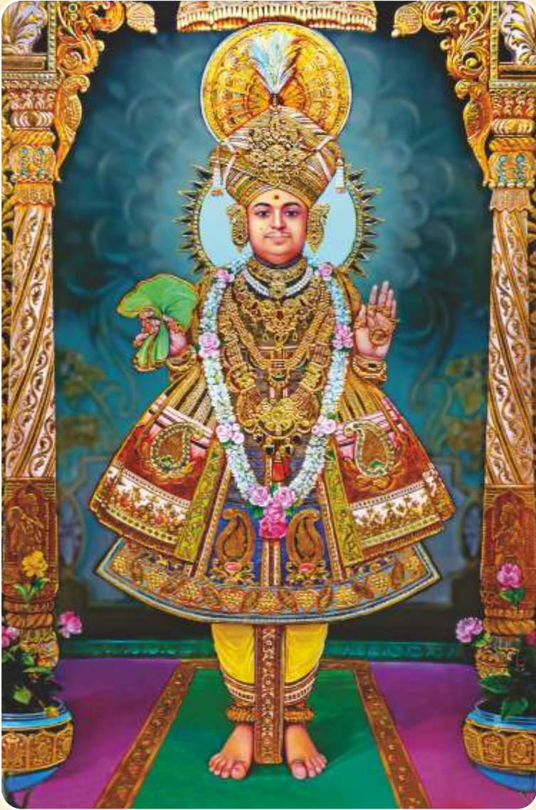
सर्वोपरी उपास्य मूर्ति पूर्व पुरुषोत्तम श्री स्वामिनारायण भगवान